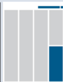
1/8 Seite hoch