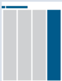
1/4 Seite hoch