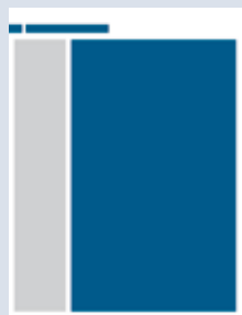
3/4 Seite hoch