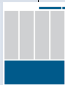
1/3 Seite quer