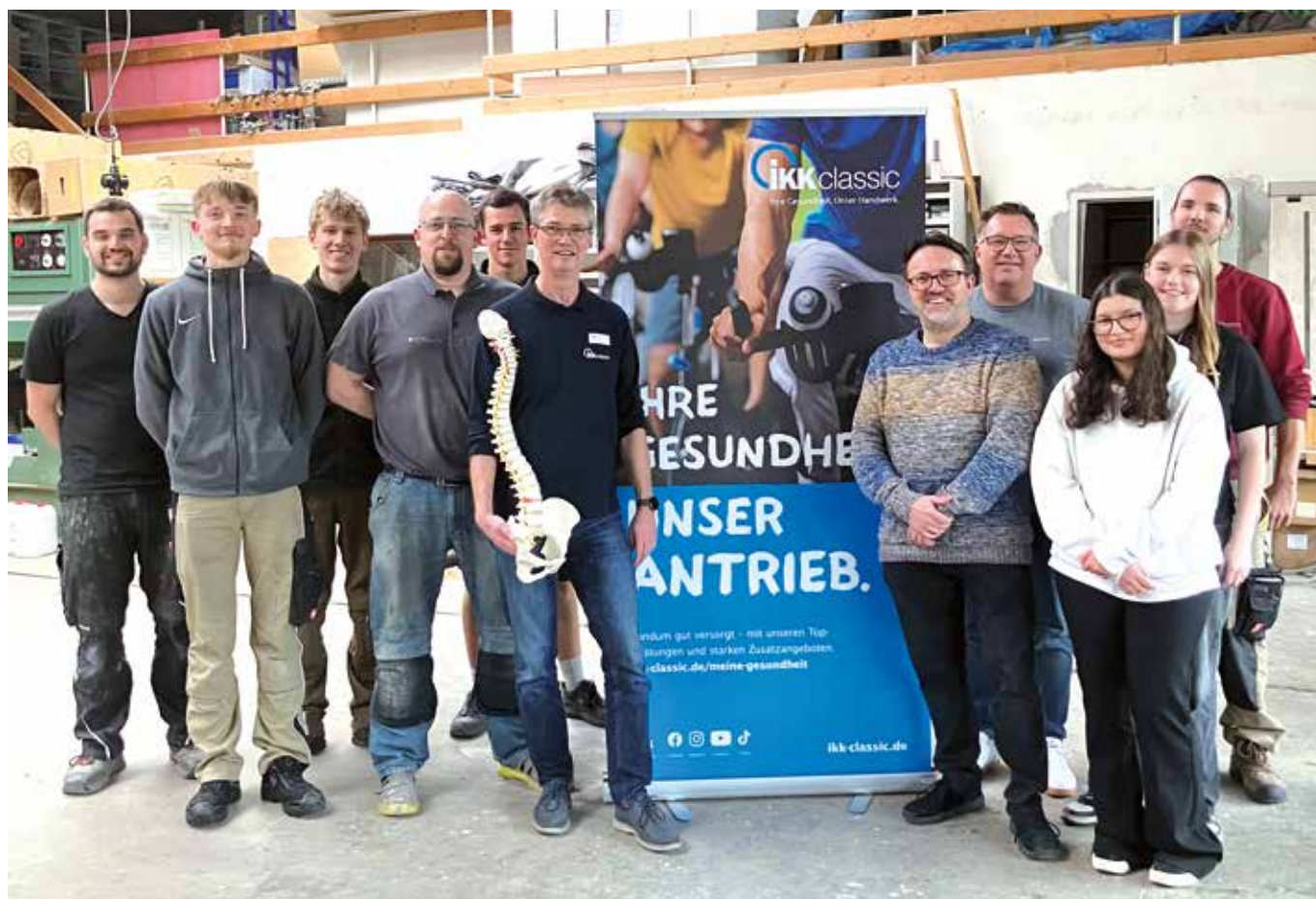
Das Team der Ohrem&Wilkening GmbH gemeinsam mit dem Gesundheitsmanager der IKK classic. Der hatte das Modell einer Wirbelsäule, inklusive des Beckenknochens zur Veranschulichung mitgebracht.

Zwischendurch gab es Zeit für Fragen und Austausch. Die Stimmung war locker, die Tipps praxisnah – genau das,