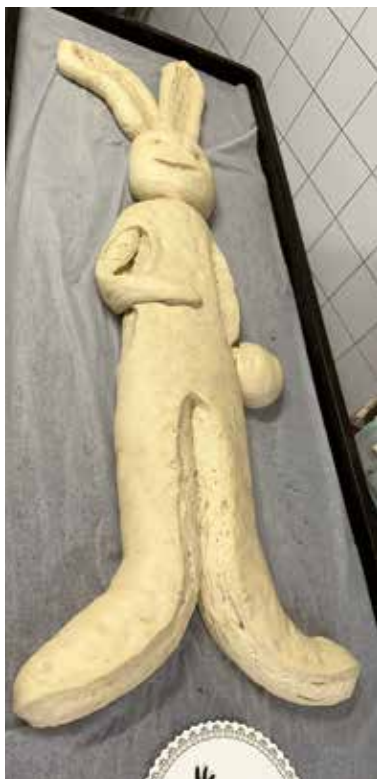
Sieben Kilo Hefeteig, von Meisterhand in Hasenform gebracht, warten auf den Backofen.