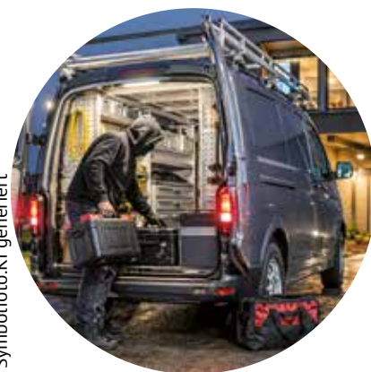
Symbolfoto: KI generiert

Werkzeugdiebstahl bleibt Problem für Handwerksbetriebe