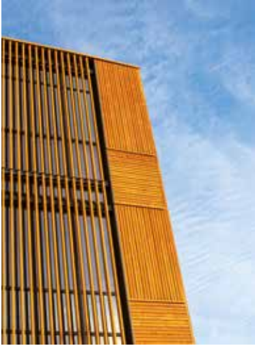
Modern und nachhaltig - Holzfassaden vom Profi.