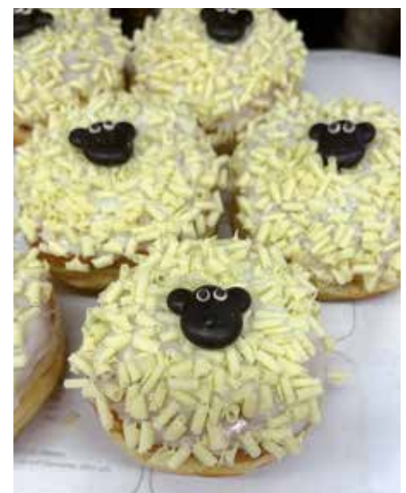
Siedegebäck, auch Fettgebäck genannt, sind feine Backwaren, die in heißem Fett schwimmend ausgebacken werden. Mit Konfitüre gefüllt werden sie im Rheinland als „Berliner“ angeboten. Und auch zunehmend künstlerisch gestaltet.