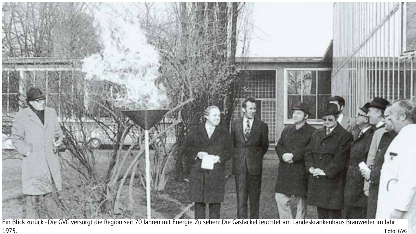
Ein Blick zurück - Die GVG versorgt die Region seit 70 Jahren mit Energie. Zu sehen: Die Gasfackel leuchtet am Landeskrankenhaus Brauweiler im Jahr 1975.

1956 von der rhenag Rheinische Energie AG und der Stadt Köln als Gasversorgungsgesellschaft im Landkreis Köln mbH gegründet, startete die GVG mit neun Mitarbeitenden und dem Auftrag, die Region mit Gas zu versorgen. Nur kurze Zeit später gesellten sich zur Stadt Köln die Gemeinden Hürth, Wesseling, Rondorf, die Stadt Frechen und der Landkreis Köln. Der Netzausbau begann unmittelbar, erste Leitungen und Hausanschlüsse entstanden. Die Anfangsjahre waren jedoch zunächst von Zurückhaltung bei Kundinnen und Kunden und dem Handwerk geprägt, Kohle und Öl beherrschten den Markt. Mit der Umstellung der Gasnetze und -geräte auf Erdgas in den 1960er-Jahren gewann das Unternehmen an Bedeutung. Von da an wuchs das Netz und die Zahl der Kundinnen und Kunden