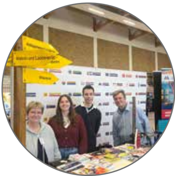
Das Team der KH betreut die „Straße des Handwerks“ und informiert über die Ausbildungschancen in den mehr als 100 Handwerksberufen

Im Goldenberg Europakolleg hat die inzwischen 28. Hürther Ausbildungsbörse stattgefunden. Fast 100 Unternehmen präsentierten ihre Aus- und Weiterbildungsangebote. Wegen umfangreicher Sanierungsarbeiten im Europakolleg war die Messe diesmal auf den Bereich der Sporthalle begrenzt worden. Die Veranstaltung bot Einblicke in rund 100 verschiedene Berufsbilder aus den Bereichen Industrie, Einzelhandel, Lebensmittel, Pflege und Gesundheit, Dienstleistung, IT und Kommunikation, Handwerk, Verkehr und Entsorgung. Auf der „Straße des Handwerks“ präsentierten die Innungen der Kreishandwerkerschaft Rhein-Erft die Vielfalt der 130 handwerklichen Berufe. Dass die handwerkliche Ausbildung bei den Jugendlichen hoch im Kurs steht, wurde bei der diesjährigen Hürther Ausbildungsbörse deutlich: Zahlreiche junge Talente suchten gezielt den Dialog mit den ansässigen Handwerksbetrieben, um sich über Ausbildungsmöglichkeiten und Karrierewege im Handwerk zu informieren.